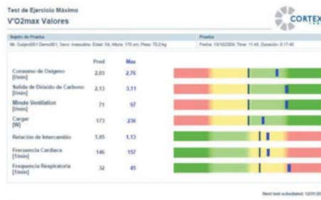
Informe de valores VO2max y otros