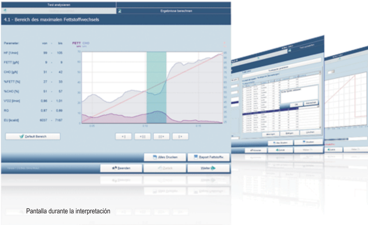
Pantalla durante la interpretación

Gracias al sencillo programa para Windows, AIRCHECK nos permite realizar un diagnostico deportivo en menos de 20 minutos utilizando una bicicleta o un tapiz rodante, así como un estudio detallado del consumo de grasa y carbohidratos que el individuo quema en reposo o durante el ejercicio, midiendo con precisión los parámetros mas importantes del metabolismo de la energía de forma individual no como un calculo estimado.