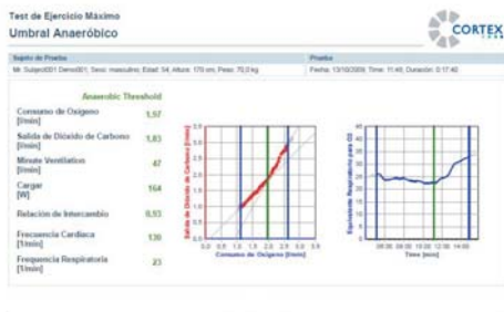
Informe determinación de umbrales