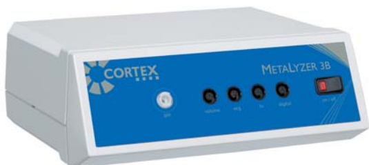
Sistema METALYZER SPORT

La principal diferencia entre ambos sistemas es la utilización de mascararas y sensores reutilizables en el modelo Metalyzer SPORT o de un solo uso en el modelo AIRCHECK