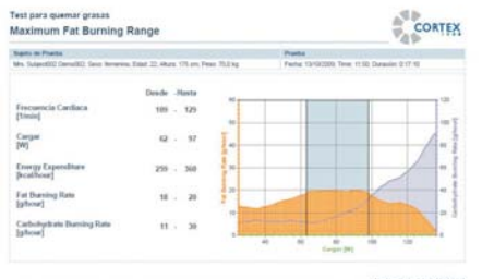
Informe de quemado de grasa