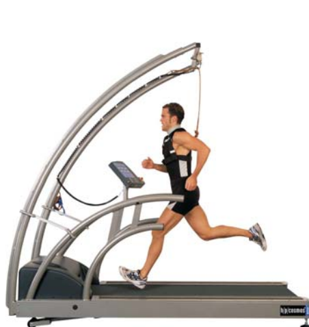
Tapiz rodante h/p/cosmos