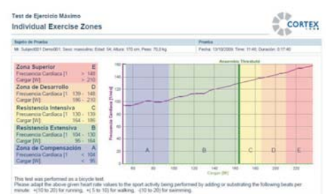
Informe tabla de proyeccion de ejercicio